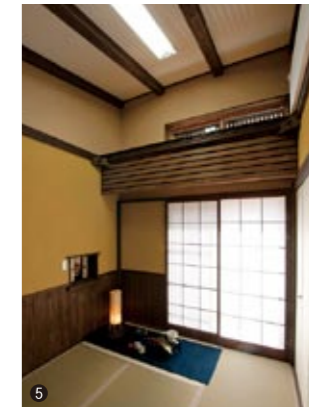
⑤ 天井にあしらった障子。スライド式なので開けたり閉めたりして明るさを調節できる。