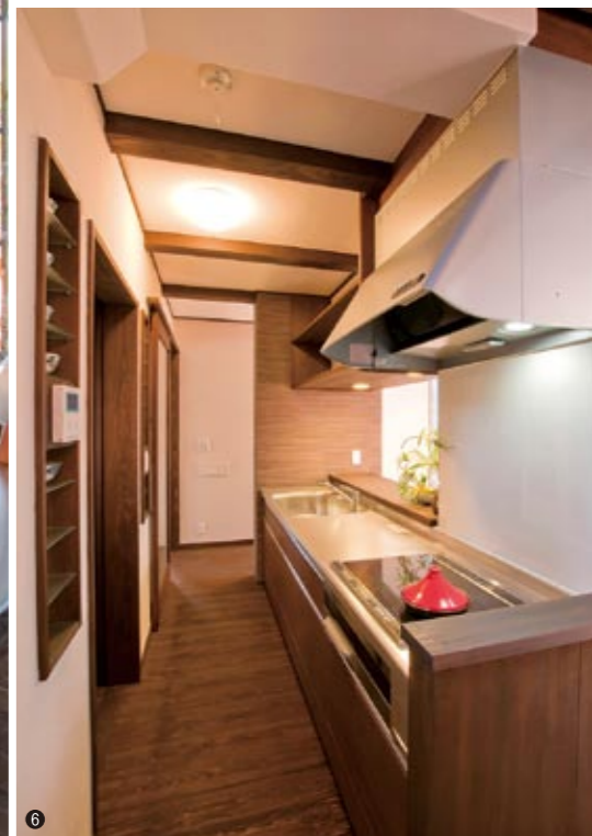
⑥ 最新の機能と収納量を誇るキッチン。シックな外観が現代町家にしっかり馴染む。⑦ 吹き抜けが開放感あふれるダイニング。千本格子風の窓が、光のゆらぎを演出。