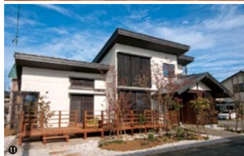
⑩ リビングからつながる広々としたウッドデッキ。アウトドアリビングとして家族の絆を深めてくれる。⑪ 八尾の町家をイメージした外観。豊かな植樹とともに、美しい町の風景を造り上げる。

「家は人を育てる。弊社が家づくりで何より大切にしていることです。人は環境に影響されやすい生き物。だからこそ真に健康な家が必要です。そうして辿り着いたのが木の住まい。木の住まいは、体はもちろん心まで健康的にします。体と心が元気なら、家族は幸せな毎日を送ることができる。この思いで一棟一棟、丁寧に家づくりをしています」