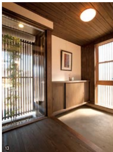
⑬ 木の温もりがただよ玄関。たっぷりの収納量が、いつも片付いた美しい空間を実現。 ⑭ 格子戸とグリーンを配置した玄関ホール。くつろぎの空間がお客様をお出迎える。